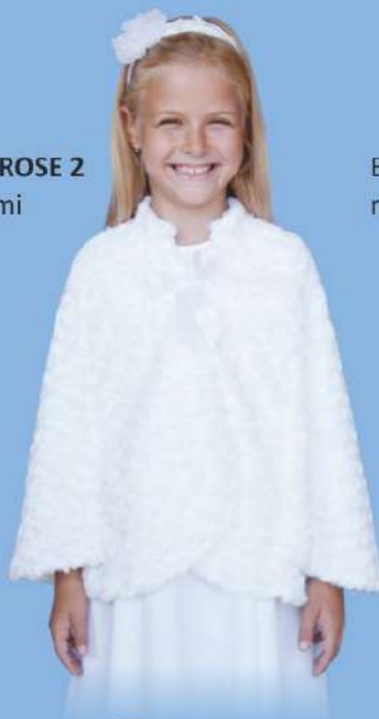
Pelerynka ROSE 2 z rękawkami