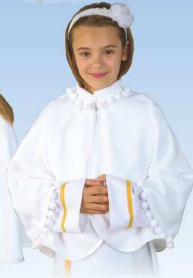
Pelerynka P8 ozdobre bąbelki przy stójce i rękawach