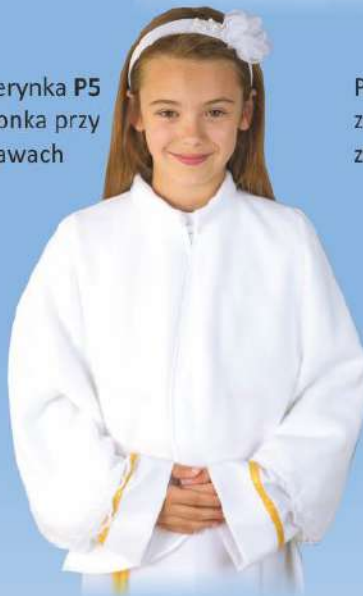
Pelerynka P5 koronka przy rękawach