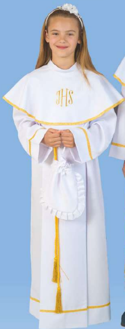
chłopiec A-XV, dziewczynka A-IIA