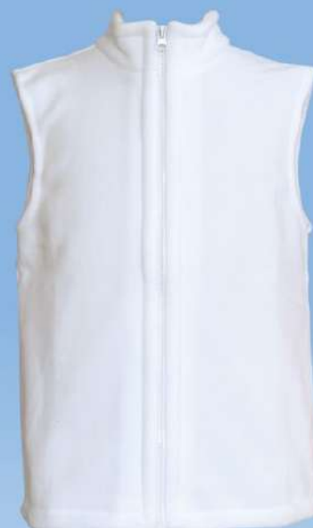
Ocieplacz ze stójką