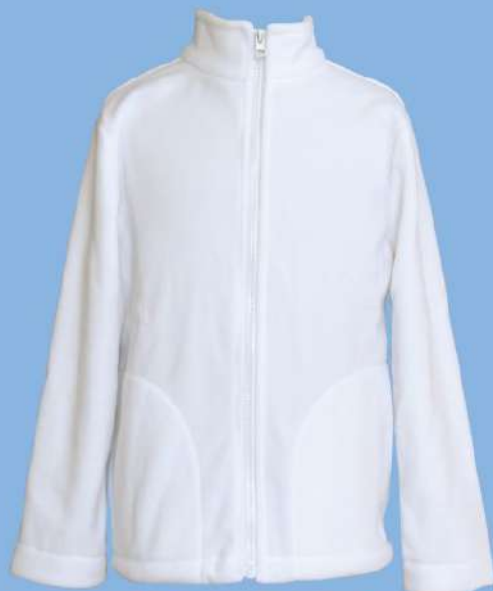
Polar bez kaptura