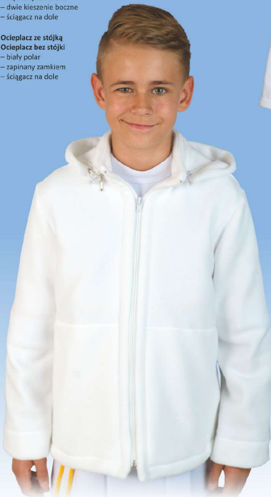
Polar z odpinanym kapturem