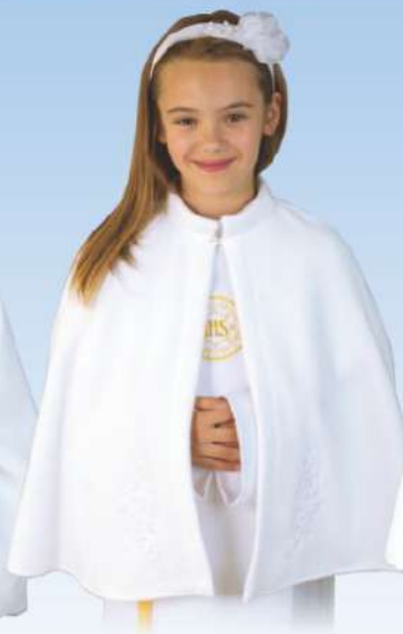
Pelerynka P6 zdobiona kwiatowym haftem