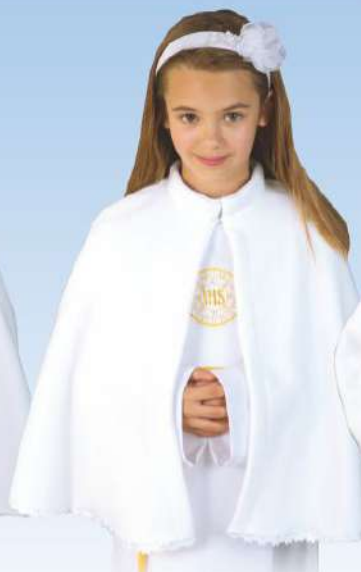
Pelerynka P12 zdobiona atlasowymi kwiatkami