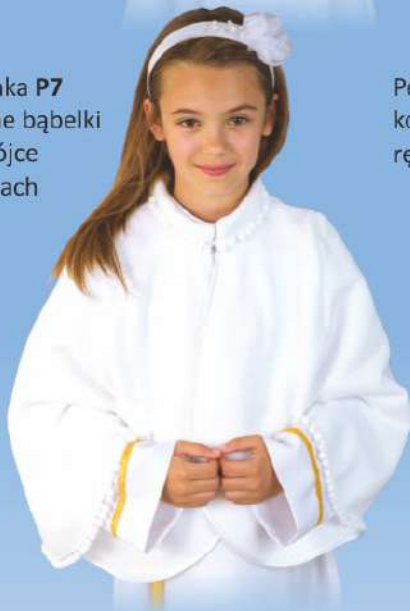
Pelerynka P7 ozdobre bąbelki przy stójce i rękawach