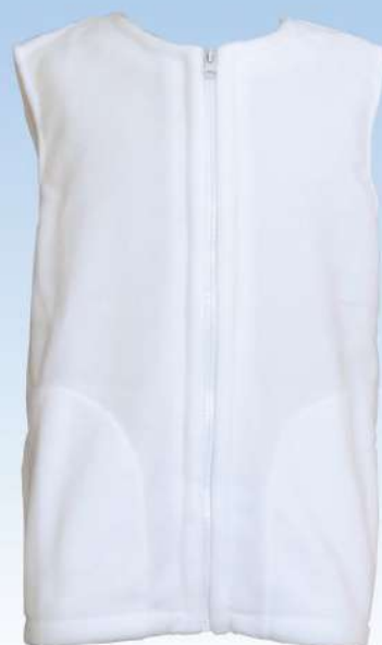
Ocieplacz bez stójki