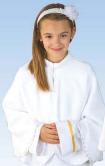
Pelerynka P14 zdobiona atlasowymi kwiatkami