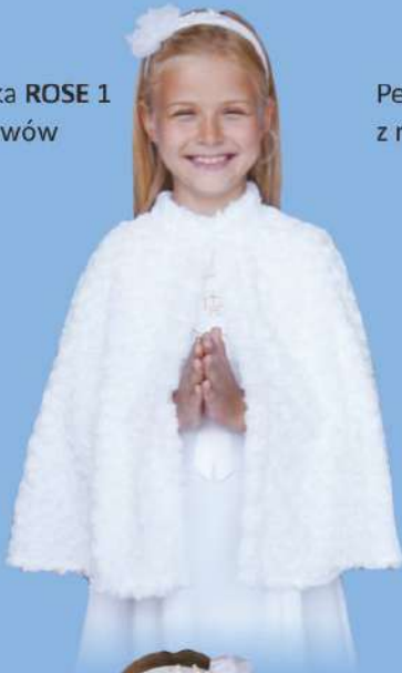
Pelerynka ROSE 1 bez rękawów