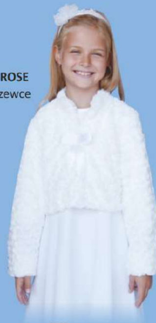
Bolerko ROSE na podszewce